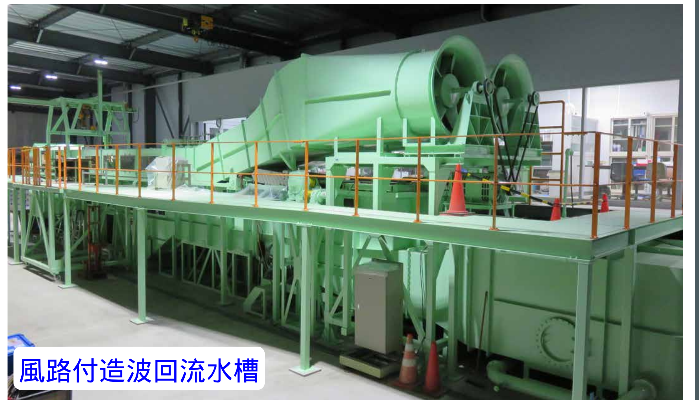
風路付造波回流水槽